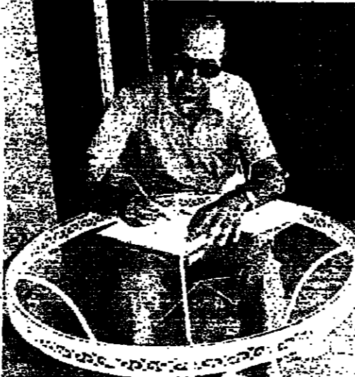
الرئيس الحص في منزله بالدمشق أمس

الايضاح الأمنية بصورة عامة ، وفي الشوف بصورة خاصة ، وردود الفعل على بيان الجبهة اللبنانية الأخير ستكون المواضيع الرئيسية في جلسة مجلس الوزراء المقرر عقدها اليوم الاثنين . اما جدول أعمال الجلسة فهو عادي ، كما أكد الوزير الدكتور ابراهيم شبيب أمس ، وسندركا بالبرامج الاستثمارية الجديدة . وسئل الوزير شبيب عن حقيقة الوضع في الجنوب والمعلومات المتوافرة لديه فقال : ان الجنوب يحق اليوم بهود نسبي ولكنه لا يثبت على الاطلاق بصورة دائمة لذا نؤمن ان تزي التسييد يقع مثل هذا الهود النسبي ، ونحن ان يستمر الجهود الحالي على امل ان يتم توكيده في المراحل المقبلة . المسرة الأمنية كانت أمس ، نسي مقدمة اهلبيات رئيس الحكومة ولا سيما موضوع الجنوب ، وكيفية جعل البلاد تتجاوز بسرعة اجواء الضيف وانظر في المواقف السياسية . ويبدو ان الخطة التي يمتددها رئيس الحكومة تقضي بتجيب الخوض في الحوار السياسي الذي فتحته الجبهة اللبنانية ببياناتها الصادر عن خلسة احمدن . الحص : الفانس لا تريد عودا ما هي الخطة التي ستجها اليها الدولة ، للكمل على تيقن المواقف السياسية والتخفيف من حثتها . السؤال طرح أمس على الرئيس الحص في منزله ، فقال : لا احاديث سياسية الآن . وسئل الحص : الى اي مرحلة ياخذ في الماسمي المهيولة لتتفسيده الرحلة الثالثة والاخيرة من برنامج شهورا تنفيذ اتفاق القاهرة ، فسرد رئيس الحكومة ، است ان في معرضه الاملا ياتي شيه ، ويهي يتفسيده تنطع لتانس عودا ، وهم يتلقون نتائج اننا ماضون في مساعينا لتحقيق الخطة الامنية المتوسطة ، وهذا الاحد ان ينفذ ذلك . وهنما نقف ذلك يدرك المواطن ان الخطة نطقت . وقبل الرئيس الحص : هل ستقومون باتصالات معينة لتحريك الوضع ودفنه